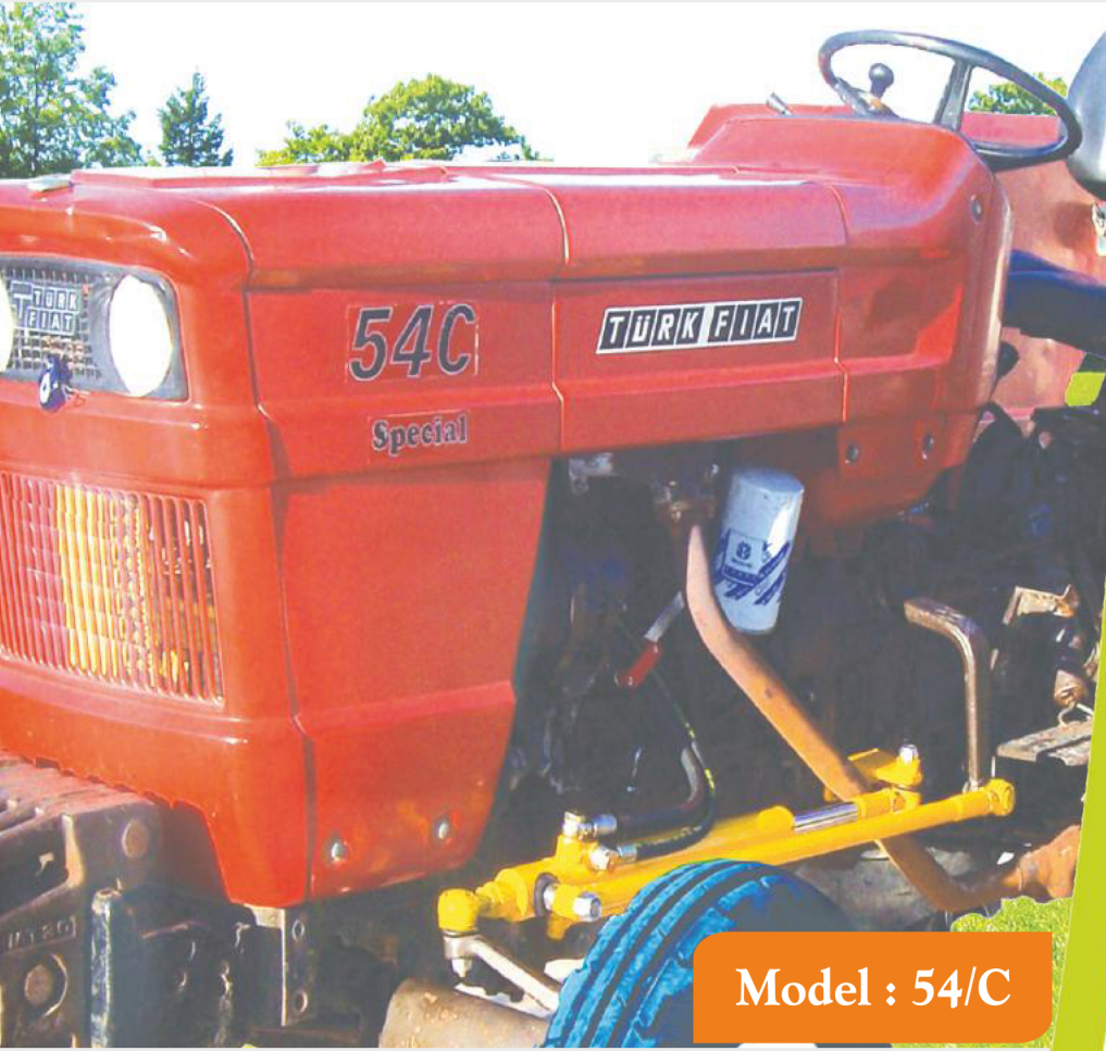
Model : 54/C